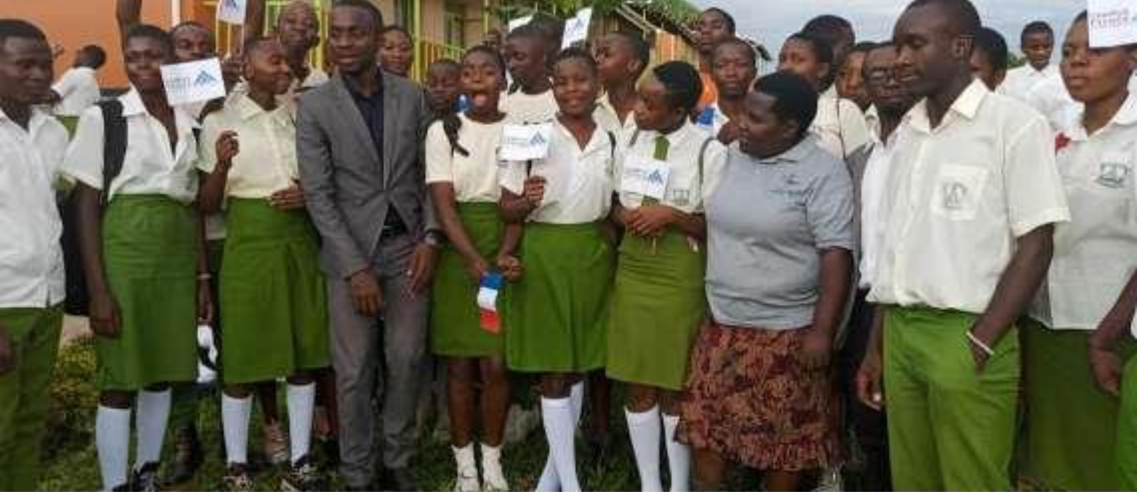
La Trésorière, le Professeur et les élèves de Bukerere S.S, lors de la Célébration de la Francophonie au mois de mars.