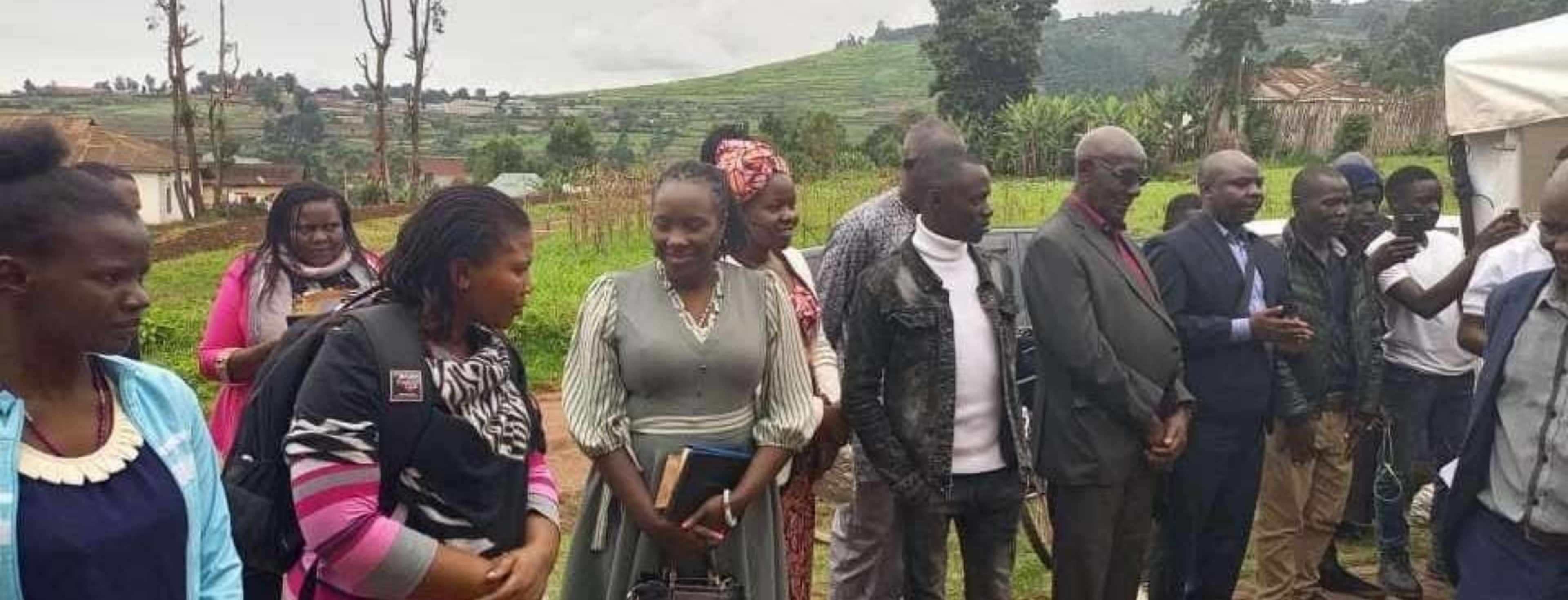
La Présidente de l'APFO, avec quelques enseignant.es et étudiants de l'Université de Kabale, lors de leur célébration à Kabale.