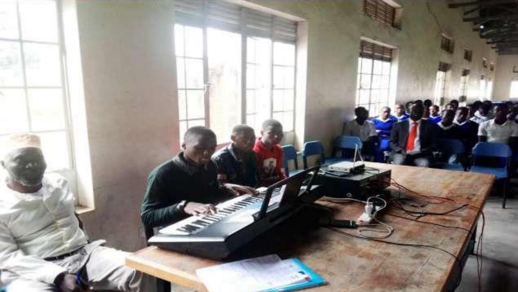
Les élèves de la région de Kisoro, lors de leur célébration à St. Paul's Mutolere SS.