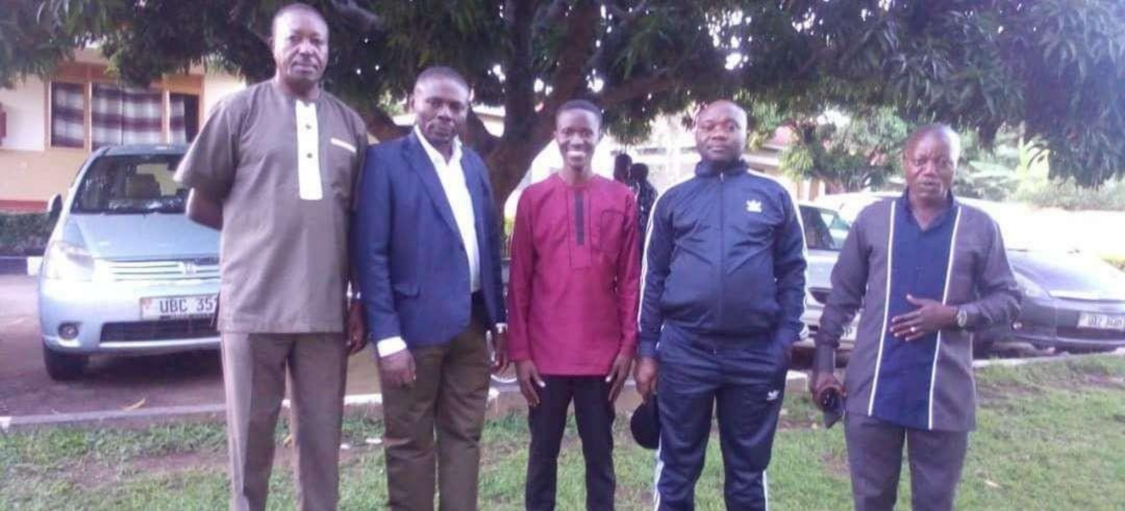
Le Secrétaire-Adjoint avec le Représentant Régional et quelques Professeurs dans la région de Masaka lors de la célébration de la Francophonie, à St. Stephen's College Bajja