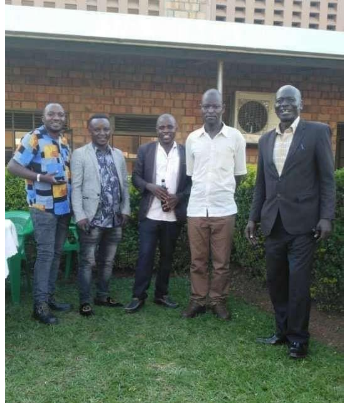
Les enseignant.es de Français, de la région de Hoima lors de la JIPF dans leur région.