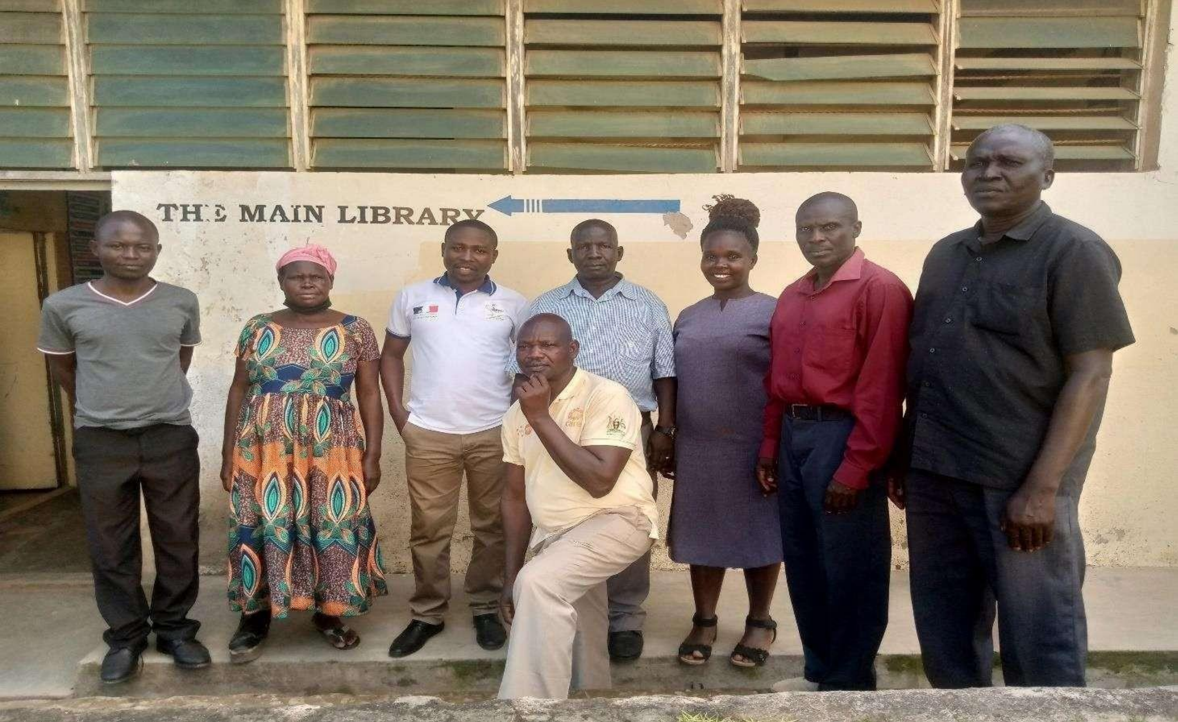
Les enseignant.es de Français, de la région de West Nile, lors de la JIPF dans leur région.